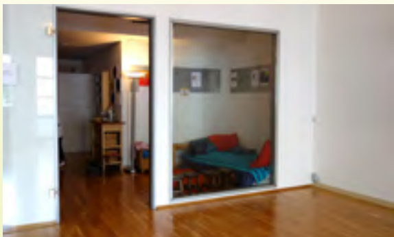
Vorraum, Garderobe, Sofa Lounge

Vermietung unserer Räumlichkeiten (ca. 140 m 2 ): Parkett, Musikanlage und abhängbarer Spiegel. Ausgestatteter Lagerraum und Balkon.