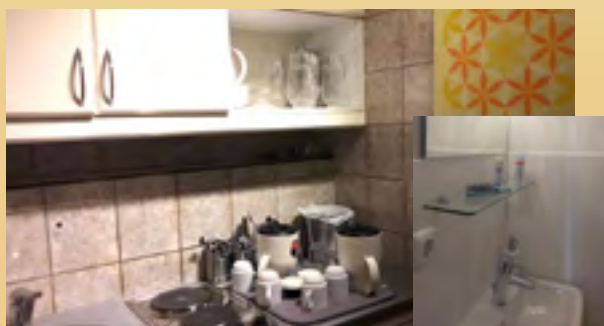
Küche, Toilette, Dusche